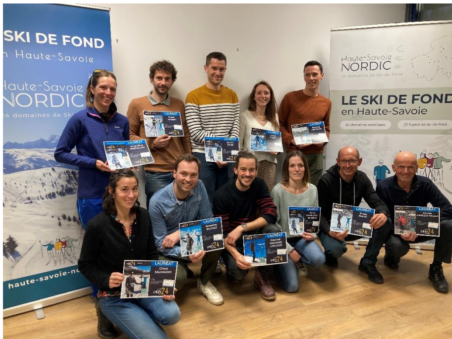
Les 11 haut-savoyards lauréats du Défi des 24 d'HSN, lors de la réunion de bilan du 04/04/2023.