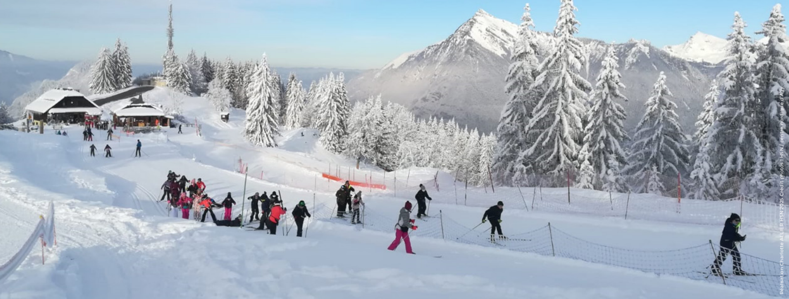
Rédaction Charlotte - 04/10/19 - 15h32Z